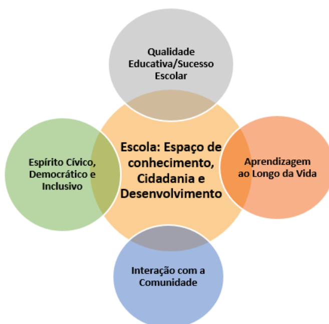
Imagem 1 - Visão de Escola assente nos Resultados, nos Valores e na Comunidade

O Agrupamento de Escolas Júlio Dinis, Gondomar pretende ser uma instituição de ensino de excelência no concelho de Gondomar, assente na Visão de uma organização escolar em que as linhas orientadoras valorizam os Direitos Humanos, através do foco na promoção e exigência da Qualidade Educativa/Sucesso Escolar , no desenvolvimento do Espírito Cívico Democrático e Inclusivo , na Interação com a Comunidade e no fomento da Aprendizagem ao Longo da Vida .